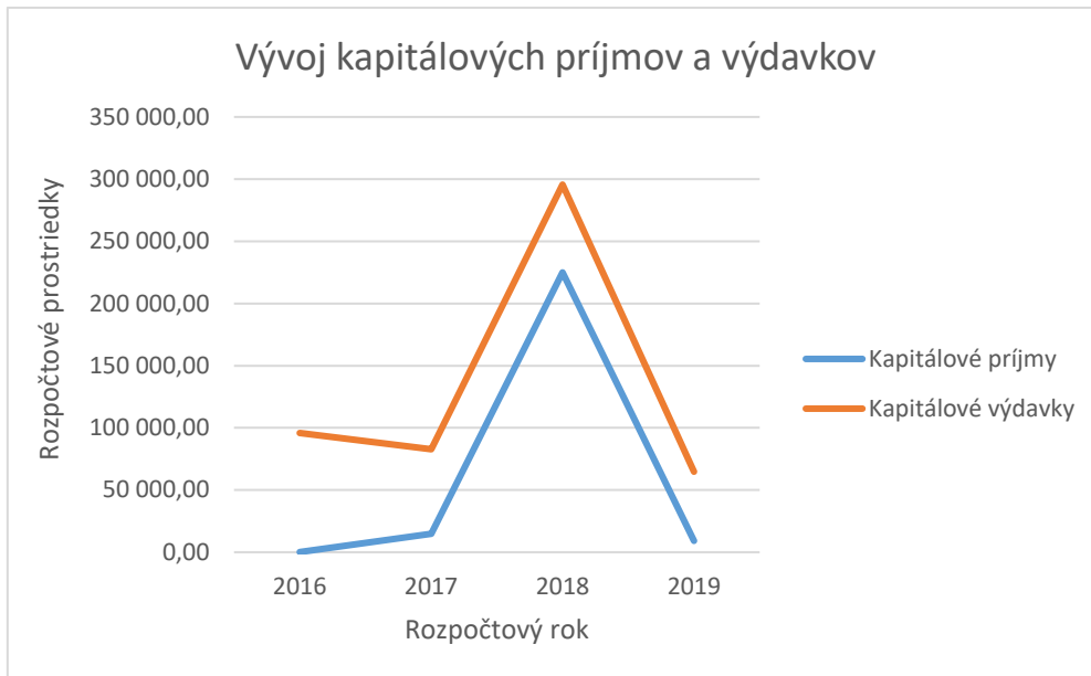
Obrázok 2 - Vývoj kapitálových príjmov a výdavkov

V rámci príjmov finančných operácií sa v predchádzajúcich rozpočtových rokoch odzrkadľuje použitie prostriedkov rezervného fondu na vykrytie straty kapitálového rozpočtu. Z dôvodu, že na vykrytie schodku kapitálového rozpočtu v roku 2019 postačoval prebytok bežného rozpočtu, nedošlo k čerpaniu prostriedkov minulých období cez príjmové finančné operácie (Obr. 3).