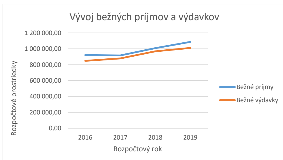
Obrázok 1 - Vývoj bežných príjmov a výdavkov

Aj napriek uvedenému stavu (Obr. 1) bežný rozpočet dosiahol prebytok vo výške 75 958,15 €. Prebytok bežného rozpočtu bol využitý na dofinancovanie schodku kapitálového rozpočtu. Nakoľko výdavky