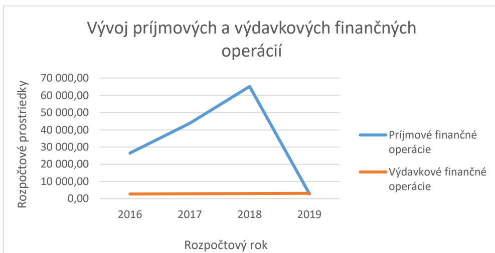
Obrázok 3 - Vývoj príjmov a výdavkov finančných operácií

Nakoľko sú kapitálové výdavky vo veľkej miere financované z prebytkov hospodárenia minulých rokov, krivka grafu vývoja finančných operácií zodpovedá krivke vývoja kapitálových výdavkov.